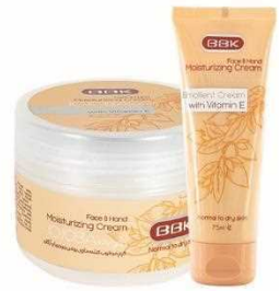
کرم جوجوبا و آرگان