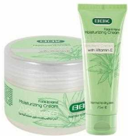
کرم آلوئه ورا