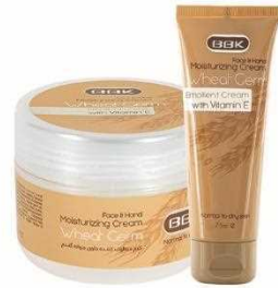
کرم جوانه گندم