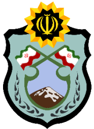
فرماندهی یگان های ویژه فراجا